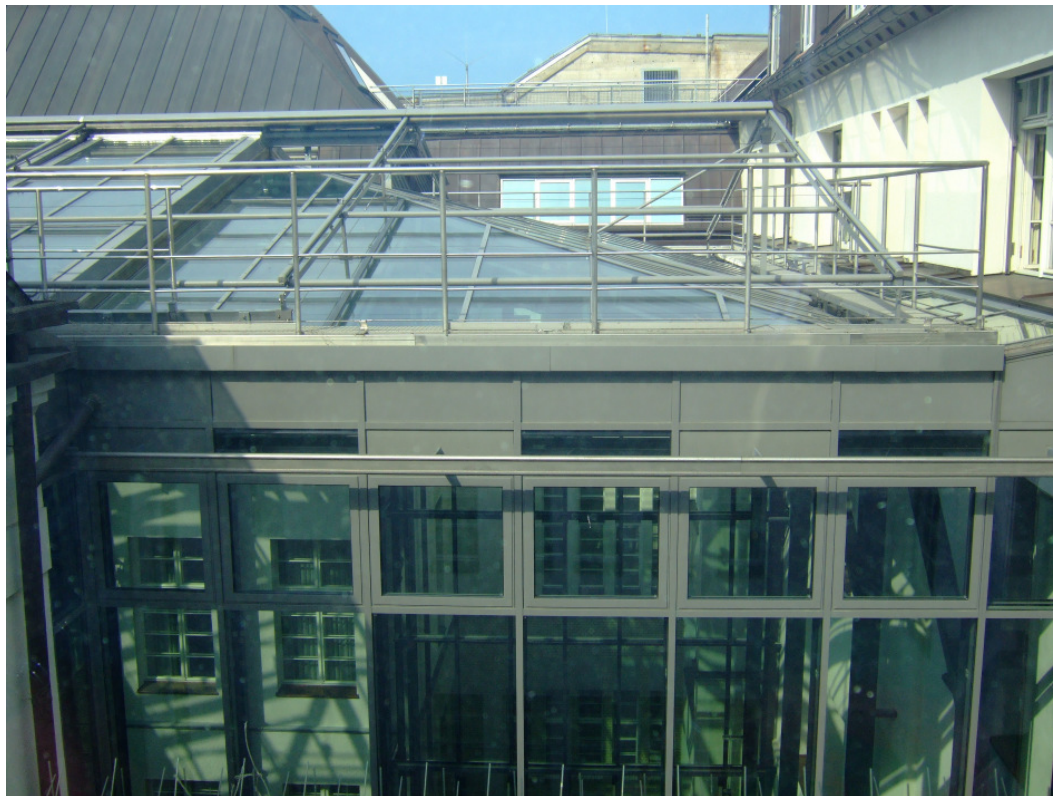
vor der Montage

Um die vielfachen Spikes auf den Fensterbänken einzusparen, was auch aus optischen Gründen nicht vorteilhaft ist, wurden die Höfe wieder neu überspannt.