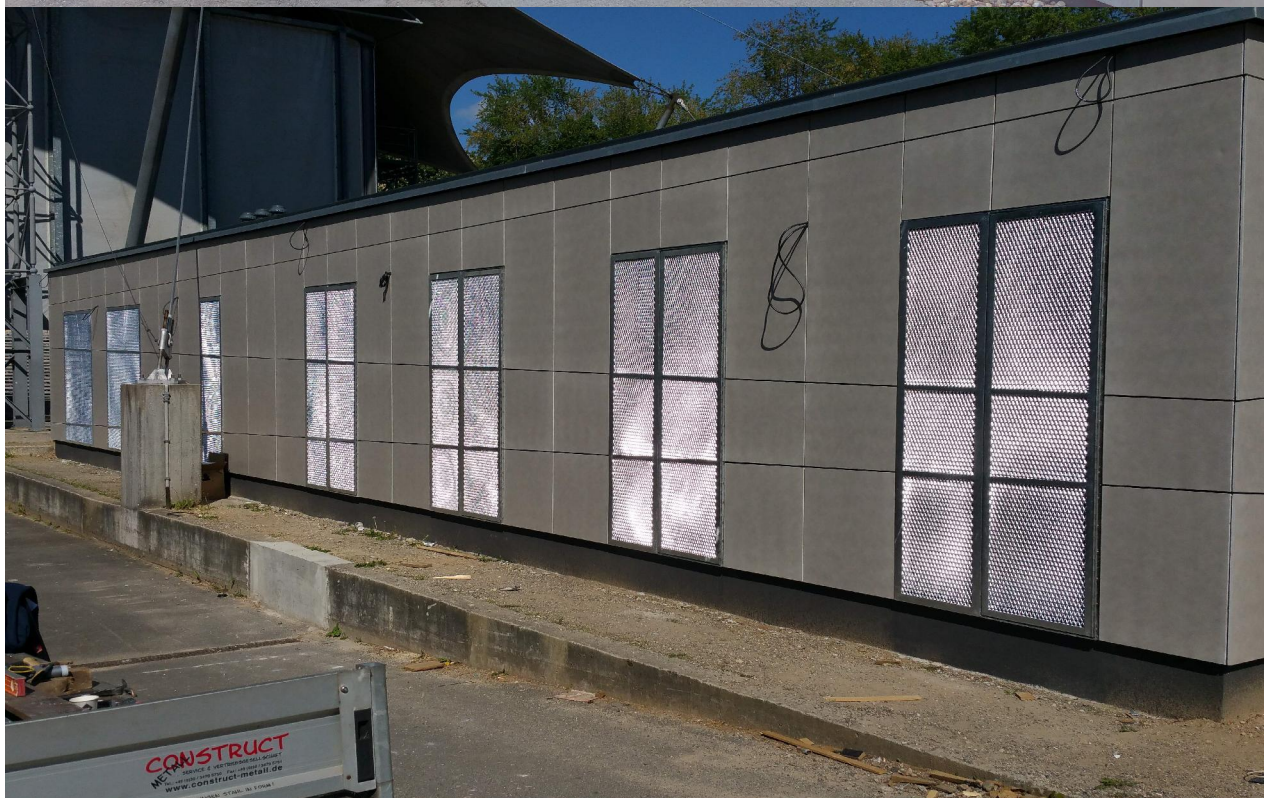
Nach der Baumaßnahme